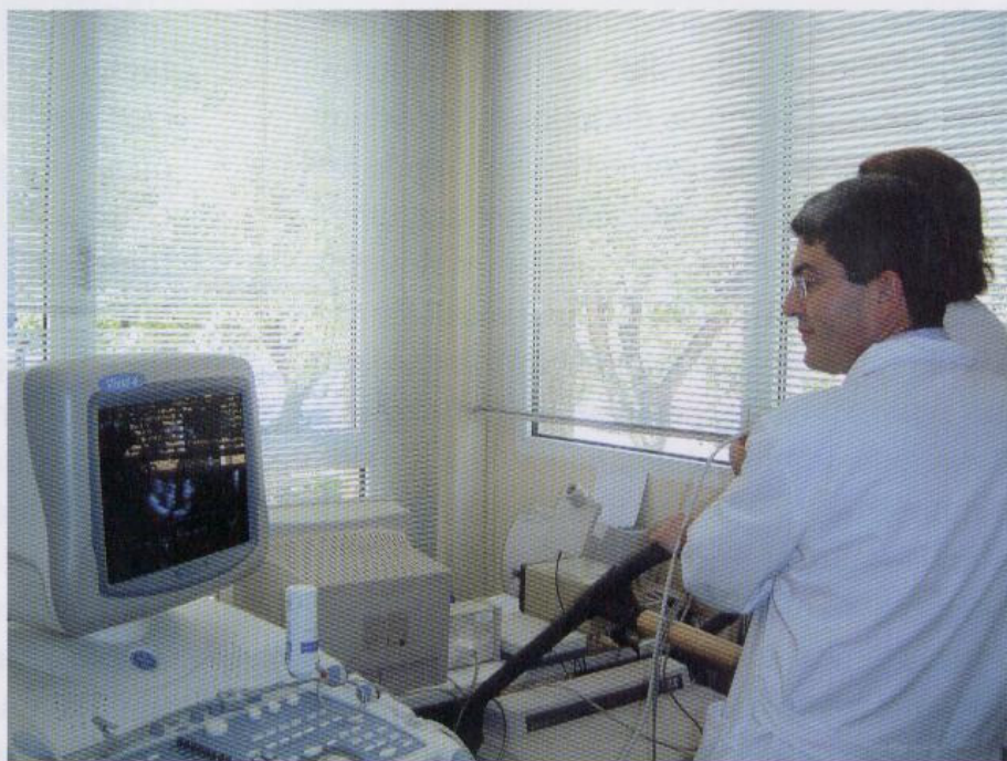
La técnica requiere un alto nivel de experiencia y un adecuado equipo ecocardiográfico

baja el corazón cuando la persona está haciendo ejercicio. USP Hospital San Carlos de Murcia es uno de los centros privados pioneros en España en la utilización de esta prueba diagnóstica en la práctica clínica habitual. Comenzó a emplearse en